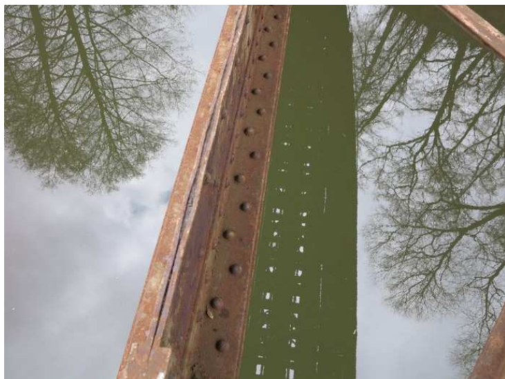
Foto č. 2 K 01 - štěrbinová koroze mezi plechy dolních stojin hlavních nosníků