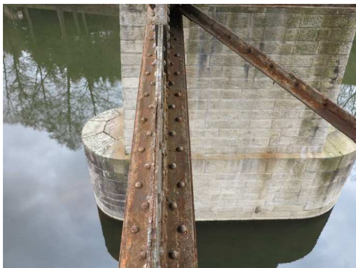
Foto č. 5 K 02 - štěrbinová koroze mezi plechy dolních stojin hlavních nosníků