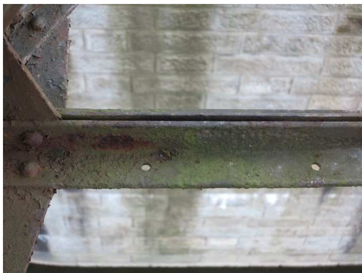
Foto č. 3 K 01 - dolní příčné ztužení, oslabení korozí konců úhelníků