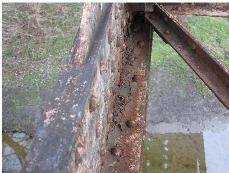
Foto č. 4 K 02 - dolní úhelníky, oslabení korozí

TÚ 1733 Kácov (mimo) – Světlá nad Sázavou (mimo) Evid. km 19,608