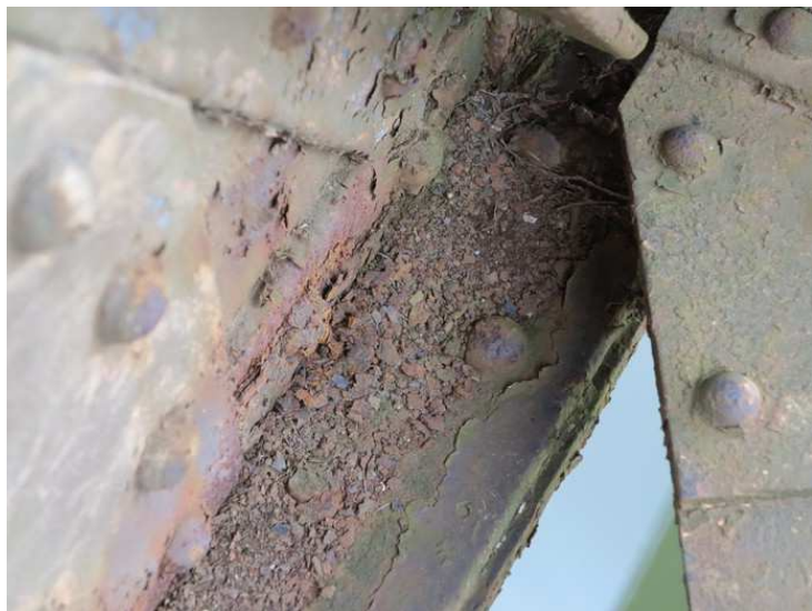
Foto č. 1 K 01 - dolní úhelníky, oslabení korozí

TÚ 1733 Kácov (mimo) – Světlá nad Sázavou (mimo) Evid. km 19,608