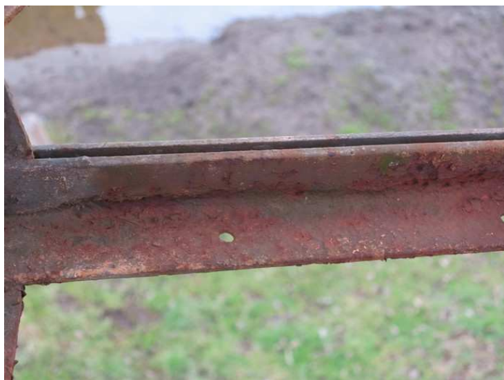
Foto č. 6 K 02 - dolní příčné ztužení, oslabení korozí konců úhelníků